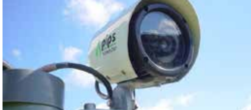
Politiezone MIRA wil cameraschild p. 2