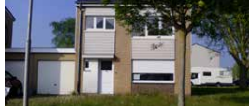
Bijna 1,9 milj. euro voor sociale woningen p. 3