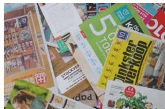
▲ Vanaf 1 juli betalen lokale handelaars een nieuwe belasting op drukwerk.