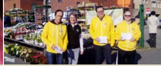
N-VA deed enquête bij marktkramers (p. 3)