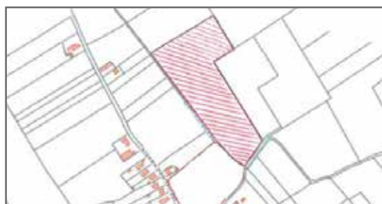
▲ De gemeente betaalde veel geld voor twee percelen dicht bij de Blauwe Poortstraat.

De gemeente koopt twee percelen landbouwgrond dicht bij de Blauwe Poortstraat (Achterkouter). Voor het terrein van ca. 3,55 hectare betaalt ze 266 205 euro. Ze wil de percelen later kunnen inzetten om via grondruil andere landbouwgronden te verwerven. Maar de manier waarop de koop tot stand kwam, doet veel vragen rijzen.