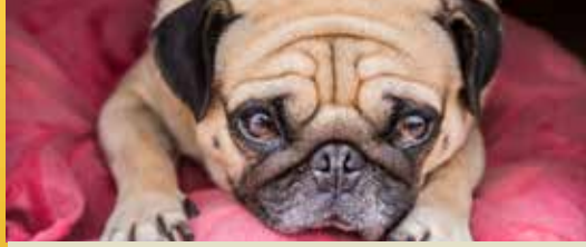
Geluidsarm vuurwerk is waardig alternatief (p. 2)